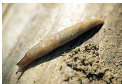
Limace grise ou « loche »